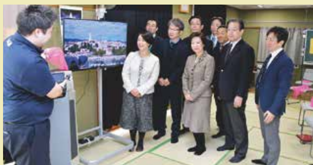
公明党議員団で鷺六高齢者会館の事業視察