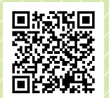
▲ナカコメは こちら