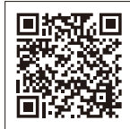
高校生 医療費無償化